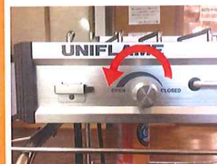
⑥つまみをオープン方向に回し、黒いボタンを押すと点火します。