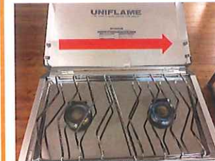
※ふたの部分が邪魔の場合スライドすれば外れます。