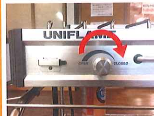
⑦火を止める際はクローズ方向へつまみを回してください。