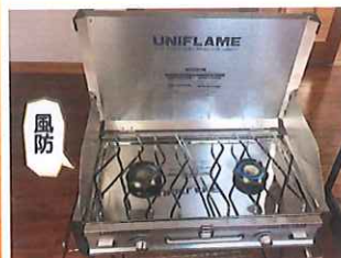
⑤ふたを開けて風防をセットするとふたが固定します。