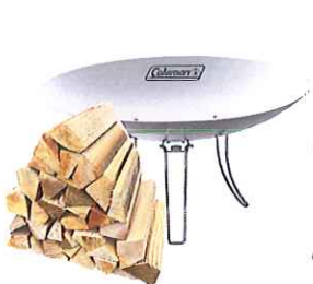
焚火台 (薪付き) (焚火シート・トンク付き) 洗ってご返却ください。