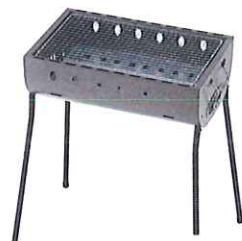
BBQコンロ (炭付き) (火ばさみ付き)