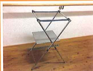
①バーナー台を広げます。