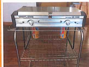
④バーナー台にツインバーナーをセットします。