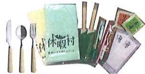
小物セット (人数分)