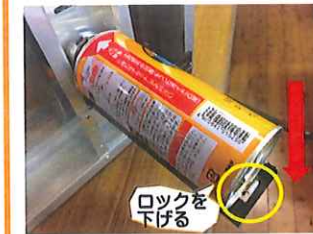
⑧ボンベを外す際は、ロックを下げてください。