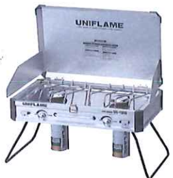
ツインバーナー (ガスボンベ2本付き) (バーナー台付き)