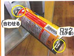
③ボンベをセットします。凹を合わせてロックします。