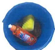
食器洗いセット (食器拭き用タオル付き 火おこし用うちわ付き)