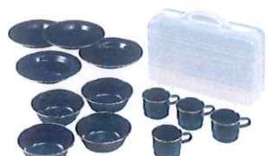
食器セット (人数分)