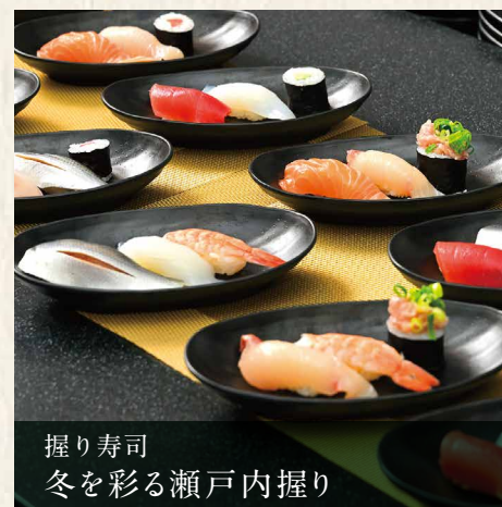
握り寿司 冬を彩る瀬戸内握り

旨みたっぷりの牡蠣と、とじ卵をやさいい出汁で仕上げました。冬にうれしい、心も体も温まるにゆうめんをお召し上がりください。