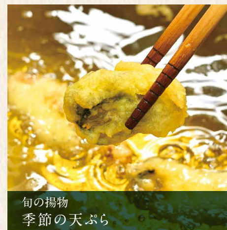
旬の揚物 季節の天ぷら

冬に旬を迎える瀬戸内の海の幸を中心に巻き寿司や稲荷寿司等、その場で握る彩とりどりのお寿司をお召し上がりください。