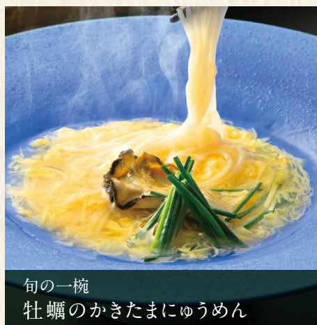
旬の一碗 牡蠣のかきたまにゆうめん

旨みたっぷりの牡蠣と、とじ卵をやさいい出汁で仕上げました。冬にうれしい、心も体も温まるにゆうめんをお召し上がりください。