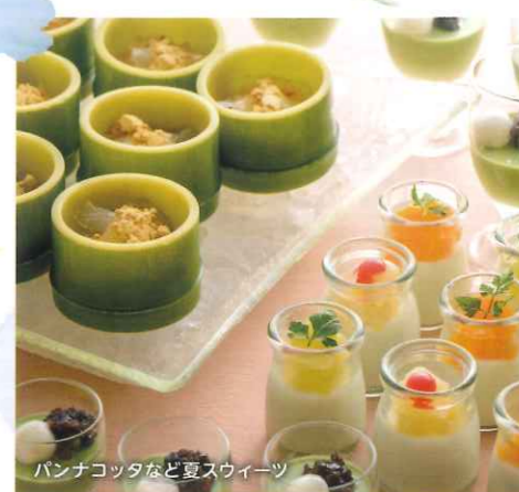
パンナコッタなど夏スイーツ