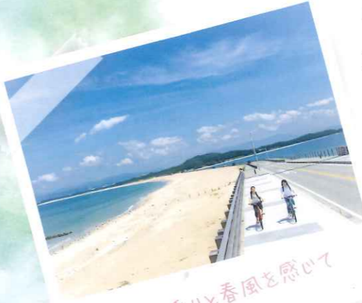
#海の香りと春風を感じて