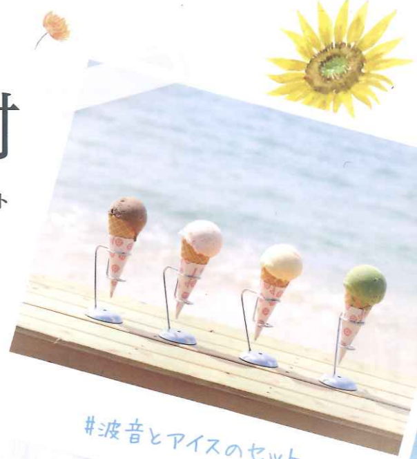
#波音とアイスのセット