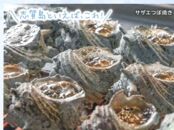
志賀島といえば、これ!