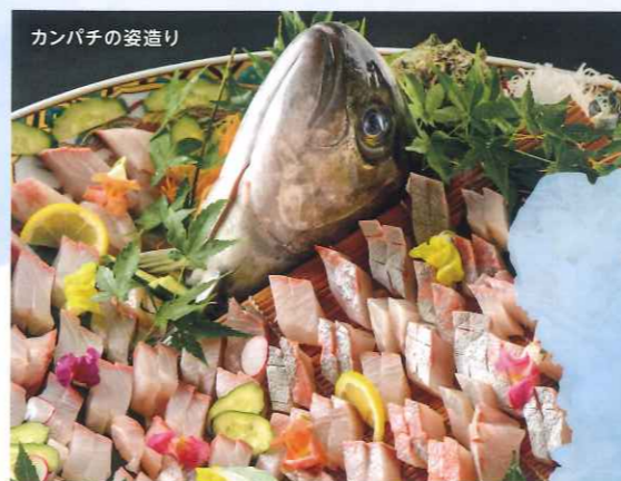
カンパチの姿造り