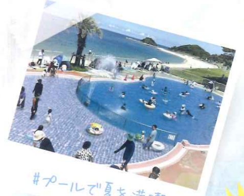
#プールで夏を満喫