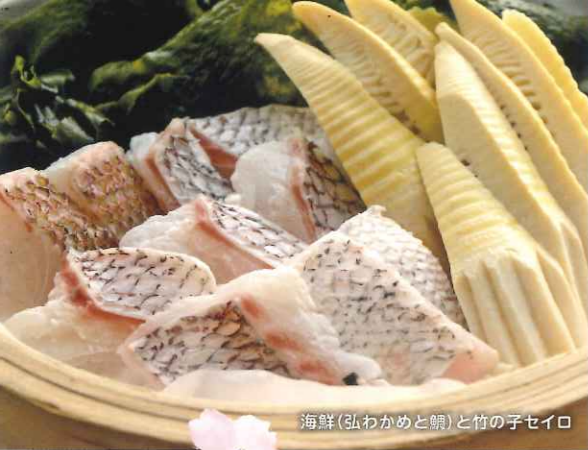
海鮮(弘わかめと鯛)と竹の子セイロ