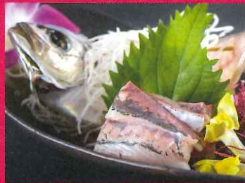
D. 九州の地魚新鮮造りと宮崎牛しゃぶしゃぶ