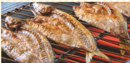
5/1~5/31 『干物の炙り焼き(かます)』