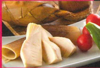
B. 合馬の竹の子鉄板焼き