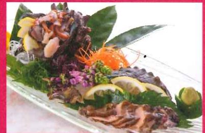
E. サザエとアワビの刺身