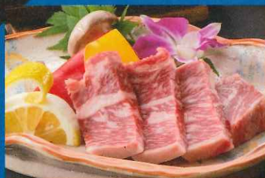
A. 肥後牛の鉄板焼き