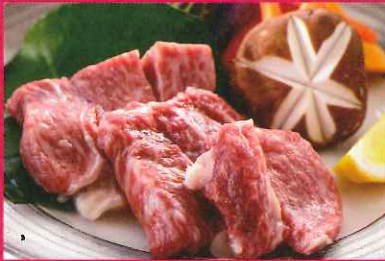
A. 伊万里牛の鉄板焼き