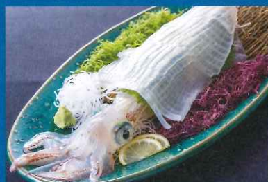
D. 活きイカ姿造り ※2名様から承ります