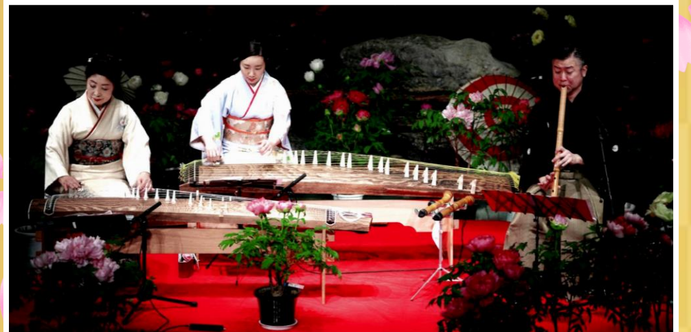
※各写真はイメージです。