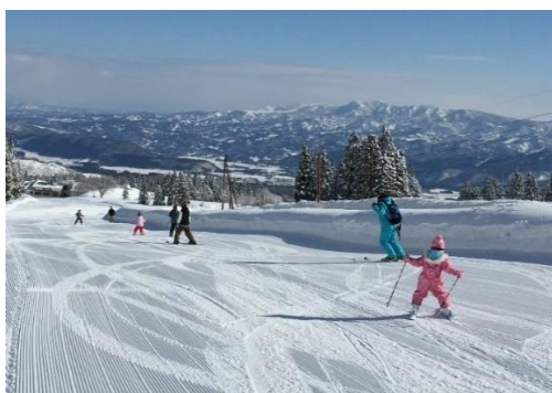
休暇村 妙高(ルンルンスキー場)