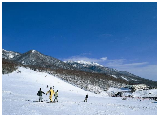
休暇村 岩手網張温泉(網張温泉スキー場)