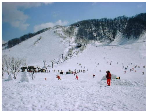
休暇村 奥大山(鏡ヶ成スキー場)