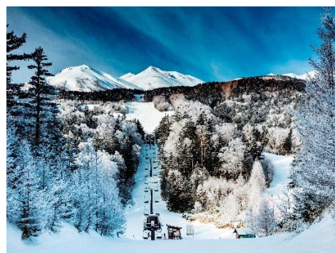
休暇村 乗鞍高原(Mt.乗鞍スノーリゾート)