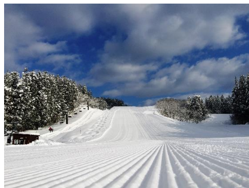
休暇村 庄内羽黒(羽黒山スキー場)