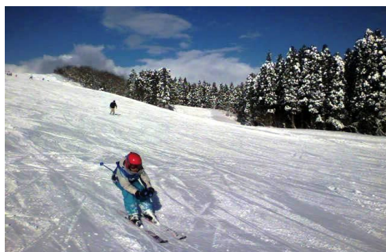
休暇村 庄内羽黒(羽黒山スキー場)