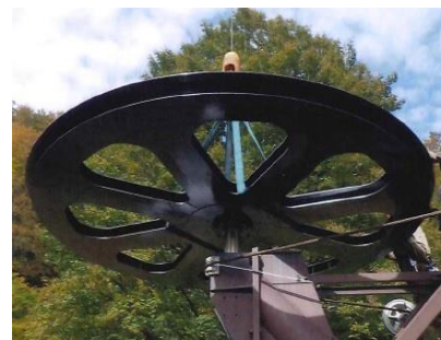
網張第2リフトA線制御装置更新工事、ロープ更新工事