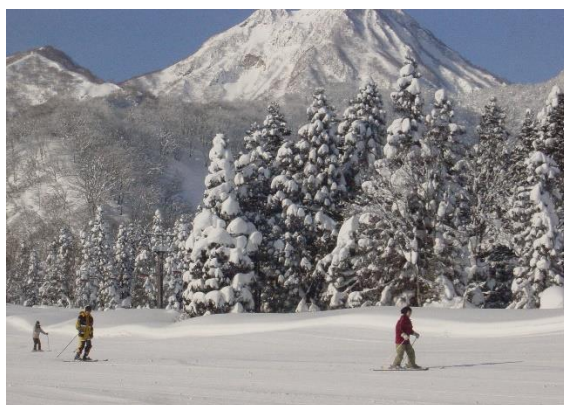
休暇村 妙高(妙高ルンルンスキー場)