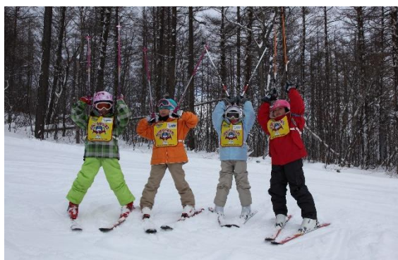
休暇村 岩手網張温泉(網張温泉スキー場)