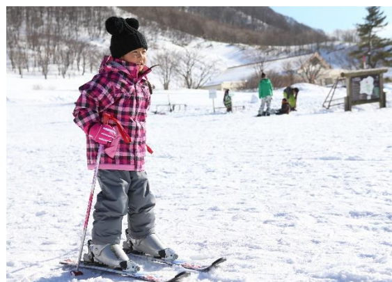
休暇村 奥大山(奥大山鏡ヶ成スキー場)