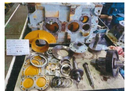
奥大山ペアリフト減速機オーバーホール