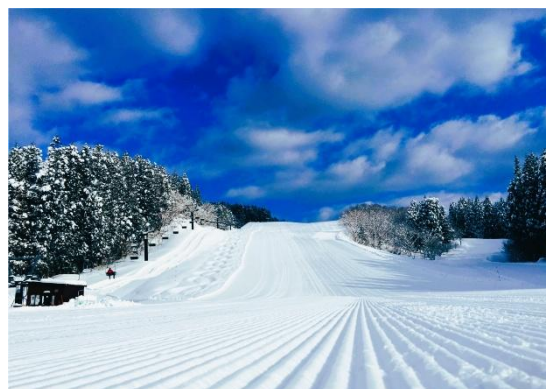
休暇村 庄内羽黒(羽黒山スキー場)