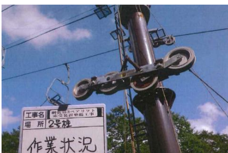
網張第3 ペアリフト受索装置整備工事

当協会は、法令等で定められた点検整備を定期的かつ入念に実施して、必要な整備・補修を行っております。また、必要な設備更新についても、計画を立てて確実に実施しているほか、緊急性の高い、突発的な修繕にも適切に対応しております。