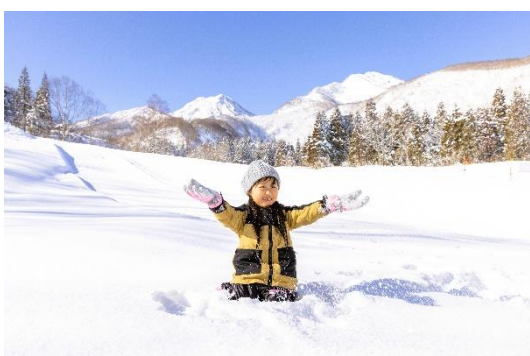
休暇村 妙高(妙高ルンルンスキー場)