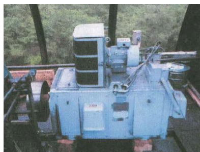
妙高ペアリフト電動機オーバーホール