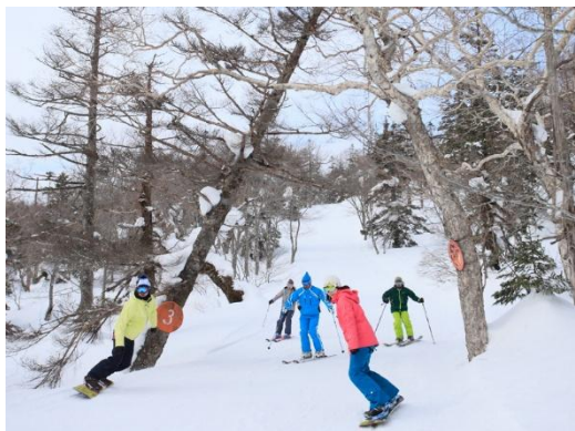
休暇村 岩手網張温泉(網張温泉スキー場)