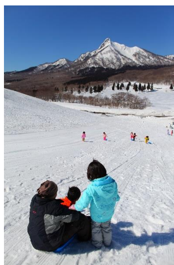
休暇村 奥大山(奥大山鏡ヶ成スキー場)