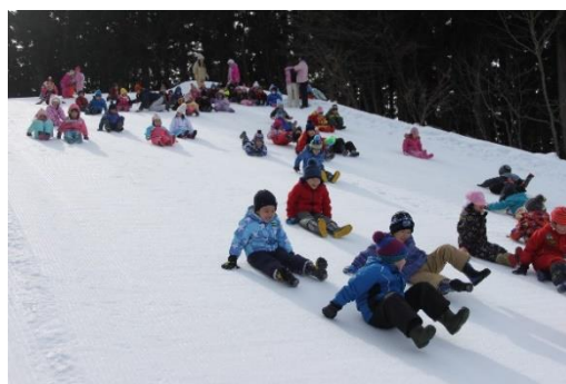
休暇村 庄内羽黒(羽黒山スキー場)