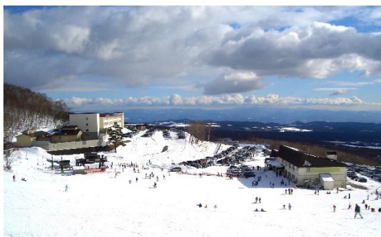
休暇村 岩手網張温泉(網張温泉スキー場)