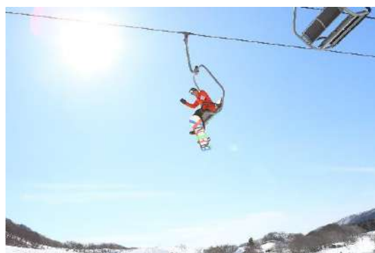
休暇村 奥大山(奥大山鏡ヶ成スキー場)