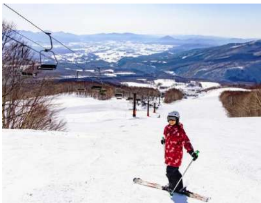
休暇村 岩手網張温泉(網張温泉スキー場)