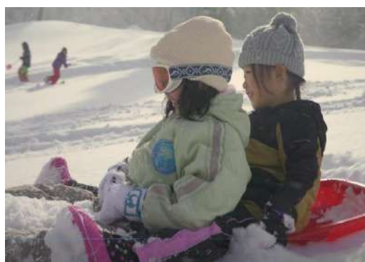
休暇村 妙高(妙高ルンルンスキー場)