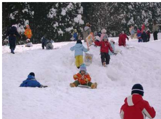
休暇村 庄内羽黒(羽黒山スキー場)