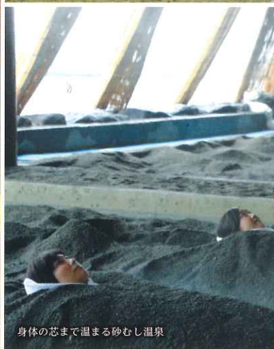
身体のおぼて温まる砂むし温泉