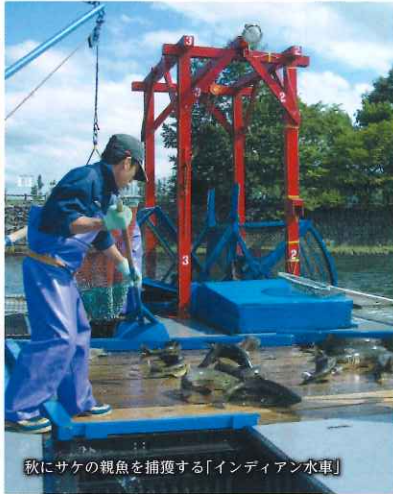
秋にサケの親魚を捕獲する「インディアン水車」