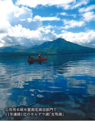
公共用水域水質測定湖沼部門で11年連続1位のカルデラ湖「支笏湖」