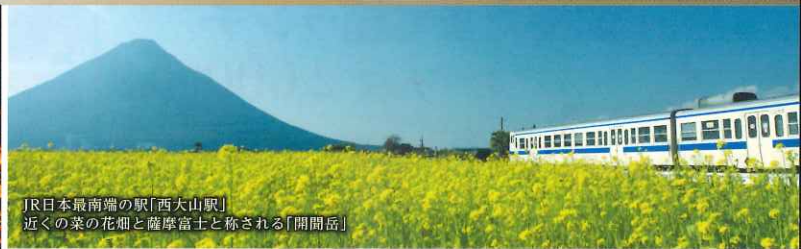
JR日本最南端の駅「西大山駅」 近くの菜の花畑と薩摩富士と称される「開聞岳」