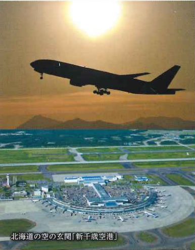
北海道の空の玄関「新千歳空港」