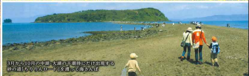
3月から10月の中潮・大潮の干潮時にだけ出現する砂の道「ちりりんロード」を渡って海さんば