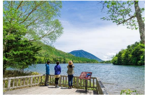
湯ノ湖畔から男体山を望む