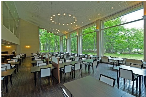
爽やかな森に囲まれたレストラン