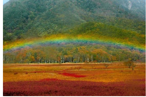
戦場ヶ原の草紅葉