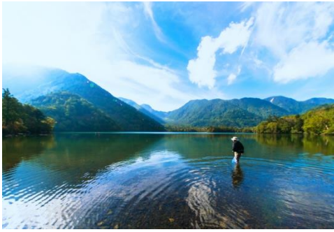
山と湖に囲まれた湯ノ湖半周コース