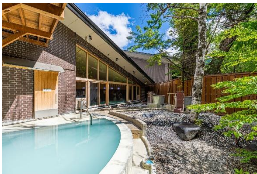
奈良時代開湯の名湯の露天風呂

▼他にも様々なプログラムを実施中です。奥日光感謝祭の詳細は下記 URL からご覧ください https://www.qkamura.or.jp/nikko/free4/?p=34