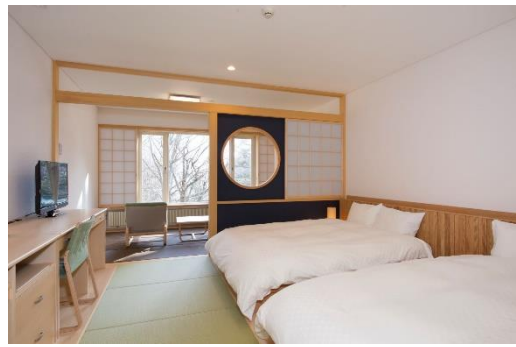
湯ノ湖に面した和洋室