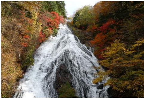
観瀑台から望む湯滝の紅葉