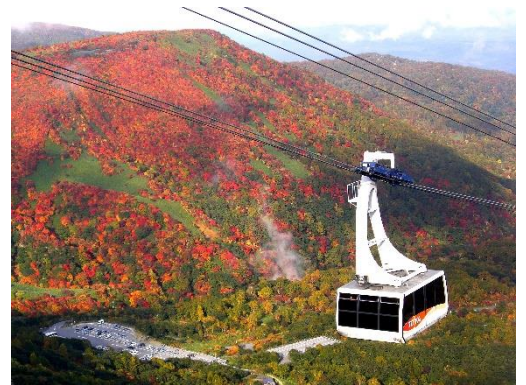
那須ロープウェイから紅葉を見下ろす