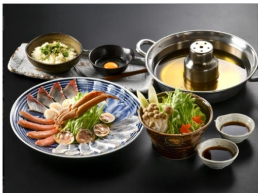
出汁と雑炊も美味しい海鮮しゃぶしゃぶ