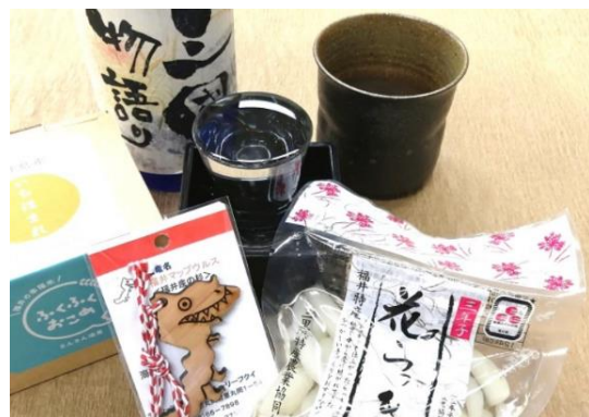
福井ならではの特典付き