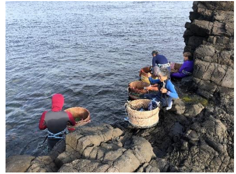
海女さんが漁をしている様子を見られるのもこの時期ならではの