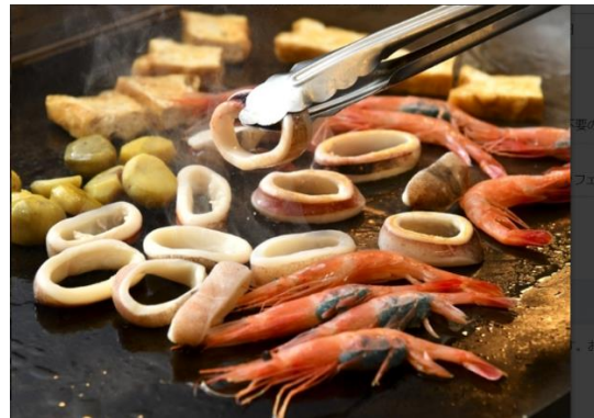
ライブキッチンでは秋の味覚と海鮮鉄板焼き