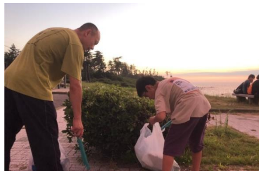
親子でご参加。夏休みの宿題として作文にして提出するそうです。