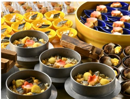
米処福井らしくお好みのトッピングが楽しい釜飯