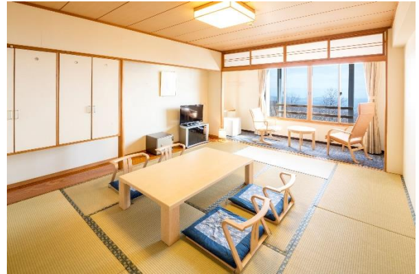
小岩井農場や雫石の田園風景を見渡す和室