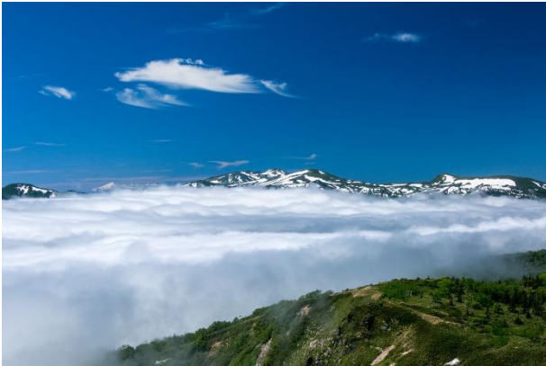
犬倉山山頂からの雲海