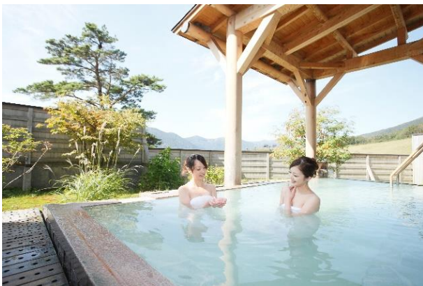
秘湯のなかでも万病に効くと伝わる網張温泉

岩手山の麓・雫石は宮澤賢治が愛した理想郷「イーハトーヴ」の舞台。名湯網張温泉は、およそ1300年の歴史を誇ります。周辺には、秀峰・岩手山や日本有数の樹海「八幡平」の雄大な自然が広がっており、7月初旬には「網張の森」で、体長わずか7mmと非常に小さく、発光が美しい希少な「ヒメボタル」を1週間程度見ることができます。