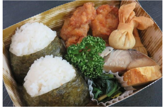
ハイカーにうれしい「おにぎり弁当」をご用意