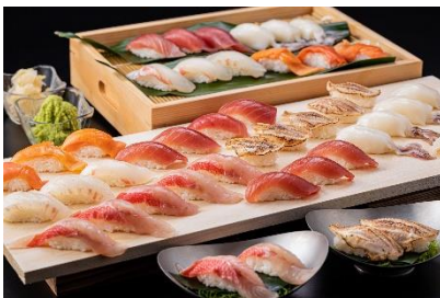
握り寿司6種（金目鯛など）