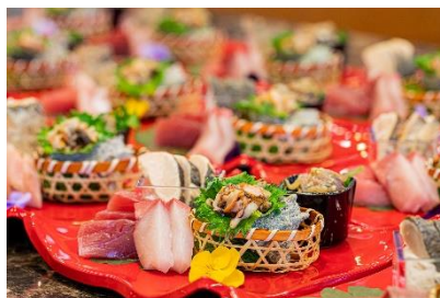
刺身5種（さざえなど）