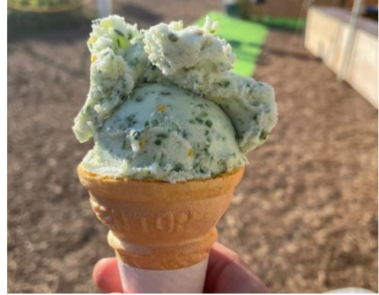
珍しい「菜の花ジェラート」や「菜の花コロケ」など、ここでしか食べられない菜の花づくしメニューも登場