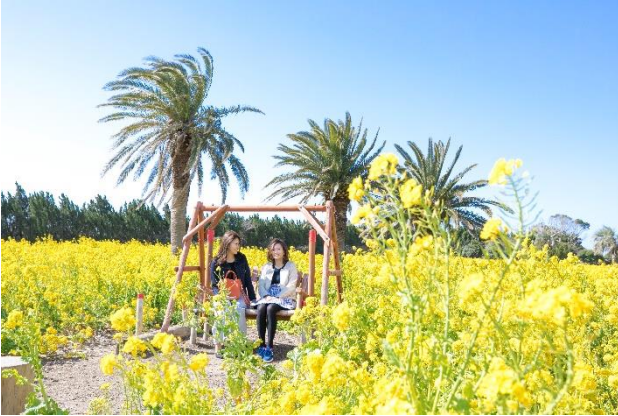
ブランコや菜の花ランウェイなどフォトスポットもたくさん