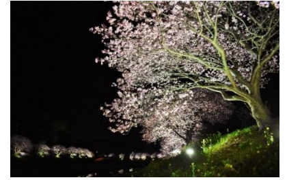
夜の桜並木は風情たっぷり！