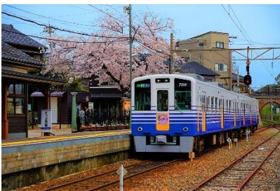
のどかな風景を楽しめる「えちぜん鉄道」。レトロな駅舎の三国港駅は列車と桜の人気撮影ポイントにもなっています。