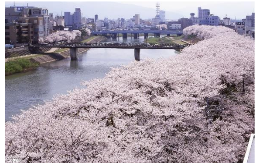
桜まつりの期間中は、食、体験、歴史、桜や福井にちなんだ様々な企画・催しが開催されます。

北陸新幹線開業を来年に控え、おもてなしの心に一層の磨きをかけ、皆様のお越しをお待ちしています。