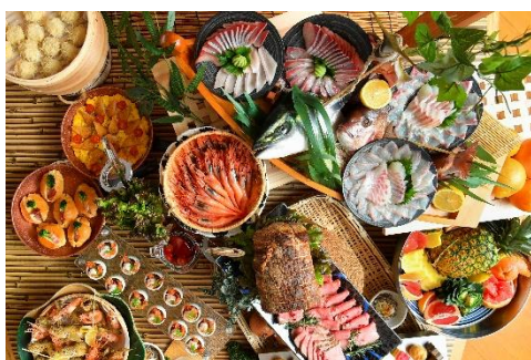
漁師の湊町「三国」をテーマにしたお魚料理と地元料理が楽しめるビュッフェコース