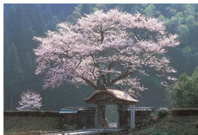
100年以上続いた朝倉氏の歴史と桜。復元町並みや庭園に桜は見事。武家屋敷や町並みの広がりの中で歴史空間を体験できます。