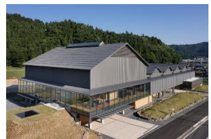
2022年にオープンした一乗谷朝倉氏遺跡博物館。まるで500年前のタイムカプセルのような遺跡から出土された沢山の宝物が展示されています