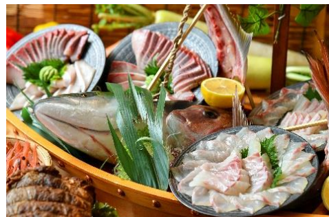
福井の地魚を姿盛りなど季節のお刺身が楽しめます。