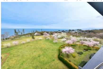
休暇村越前三国の芝生庭園では昼に宵にお花見が楽しめます

大きめの花と葉が同時に開くオオシマザクラ。塩漬けにした葉が桜餅に使われることでも知られています。3月下旬そのオオシマザクラの開花を皮切りに、一斉に咲いてお花見を盛り上げるソメイヨシノが続き、4月上旬には、高木でピンクの花が美しいヤマザクラが開花して、その様子はまるで桜の花リレー。休暇村では、ピンク色の花が湯面に映る情緒的な「お花見露天風呂」が楽しめます。