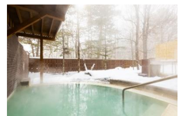
この時期ならではの雪見風呂（休暇村日光湯元）