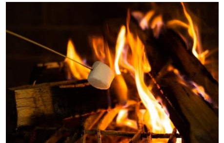
外はカリッ中はトロトロの焼きマシュマロ