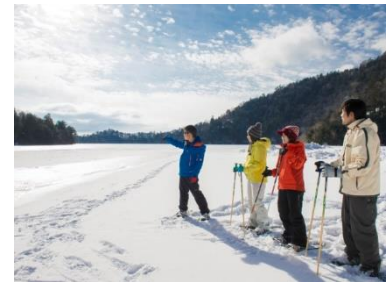
スノーシューで新雪を満喫!