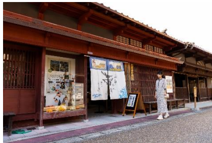
江戸時代には北前船の交易で賑わっていた三国湊。今も格子戸が連なる町家や蔵などが並びます。