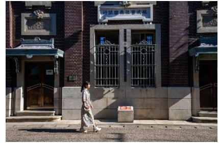
福井県内最古の鉄筋コンクリート建築の旧森田銀行本店など往時の面影を残す建物が残っています。