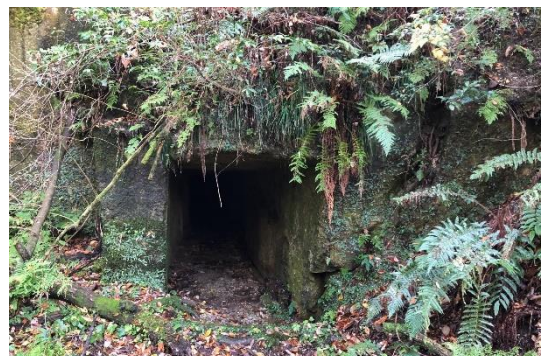
草木が生い茂る中にある洞窟のような坑道入口