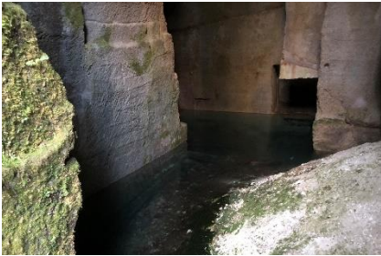
深い緑色に苔むした、まるで石造りの神殿のような神秘的な石切り場跡です。