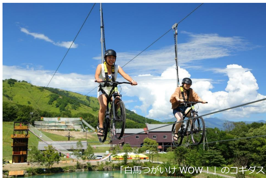
「白馬つがいけ WOW！」のコギダス

世界で話題の新感覚アクティビティが体験できます。メインアクティビティは主に6つ。「トビダス」「コギダス」「アミダス」「カベダス」「フミダス」「ポチャダス」です。「コギダス」は大きな池の上に1本のワイヤーを自転車で綱渡り。水面から高さ9mのスリリングある体験ができます。「トビダス」はゴムチューブに乗り、高さ12mから一気に滑り出し加速したところで空中へ!「フミダス」は高さ6mからエアマットに向かって一気に急降下!一歩踏み出す勇気が試されます。