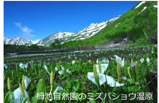
柵池自然園のミズバショウ湿原

「白馬つがいけ WOW！」よりさらにロープウェイで上がっていくと、標高約 1,900m の場所に中部山岳国立公園「柵池自然園」があります。6 月になるとミズバショウの見頃を迎え、山の上にも青々とした季節到来です。この自然園は 1 周約 5.5 km。所要時間は約 4 時間。6 月 10 日から 10 月 22 日までという短い期間の営業です。写真では伝わり切らない景色が広がっています。