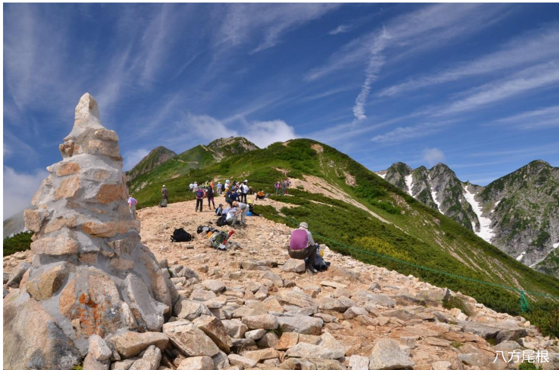
標高 2,430m の丸山ケルンから見渡す 360°の山並み

長野県安曇野市の穂高温泉郷に位置するリゾートホテル「休暇村リゾート安曇野ホテル」(所在地:長野県安曇野市穂高有明 7682-4、支配人:渡邊康広)では、6月3日より「白馬八方尾根/八方アルペンライン」リフト券付き宿泊プランを、6月10日より「樽池自然園/つがいけロープウェイ」の入園・リフト券付き宿泊プラン販売を開始します。お得にチケットを購入できるだけでなく、チケット売場での待ち時間も必要ありません。特別な時間が過ごせるマウンテンリゾートです。