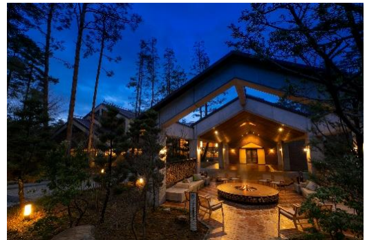
静かな森の夜に浸る焚き火 BAR 星見暖炉

温泉にゆっくり浸るもよし、林の中で木漏れ日を感じ森林浴するもよし、安曇野平に点在する美術館やわさび田、北アルプスを眺めながらのサイクリングで巡るアートの街「安曇野」を満喫するもよし。休暇村ならではの、リトリートをお楽しみください。