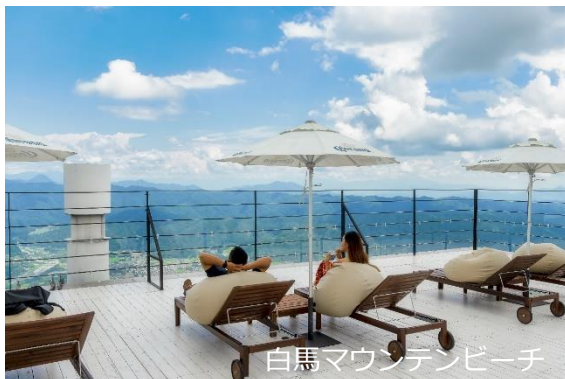
白馬マウンテンビーチ