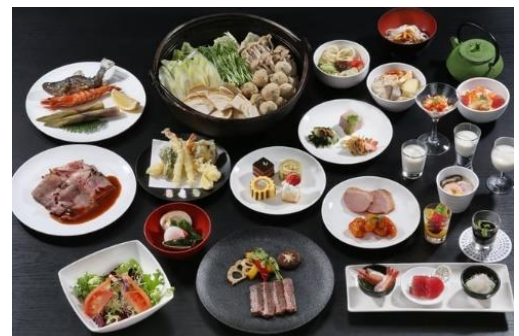
シンプルで質にこだわったグランドメニューと当地グルメが並びます