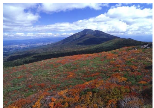
岩手県内でもいち早く紅葉が始まる三ツ石山から岩手山を望む

3本のリフトを乗り継ぐと、そこは標高1,350m!夏は涼しい風が吹き抜けます。犬倉展望台までは徒歩10分。網張温泉の元湯から噴き出る蒸気や雫石の町を遠望できます。気軽なハイキングだけではなく、三ツ石山や姥倉・黒倉を経て岩手山への登山にも便利です。秋には紅葉に染まる山々を間近に見ることも。10月上旬から中旬はカエデの赤にブナやミズナラの黄色が多く混ざり見応えが増します。