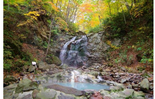
紅葉に染まる森の中の「亀滝」や「湯ノ沢」のせせらぎが心地好いロケーション