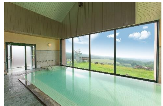
眼下に広がる雄大な景色を眺めながら入浴を楽しめます