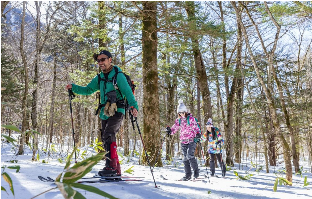
誰も足を踏み入れてない森の中を颯爽と歩きます

北アルプスを背に乗鞍岳を望む山岳リゾートホテル、休暇村乗鞍高原（長野県松本市安曇、総支配人：鈴木 隆）は、リトルピークスと提携し、ウィンターアクティビティ「ガイドが案内するネイチャースキー」体験付宿泊プランを12月23日より販売します。休暇村乗鞍高原60周年を記念して、ネイチャースキー一式を無料レンタルで提供します。