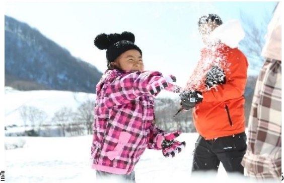
安心して雪遊びが楽しめます