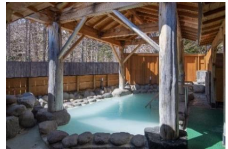
金曜日 奥日光高原ホテル 木立の緑を間近に感じる露天風呂