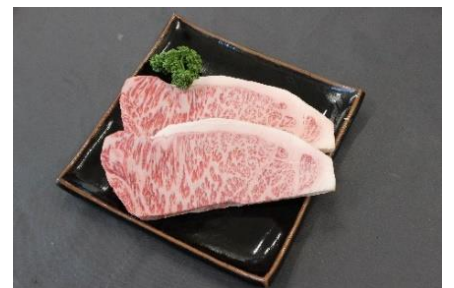
1. きめ細かい霜降り肉は柔らかく甘くとろける旨みのあるお肉です