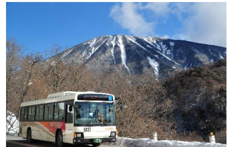
日光の冬旅を満喫 宿泊者限定の至れり 尽くせりのフリーパスです。 ※宿に事前予約が必要です