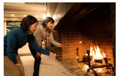
建築家“清家清”氏デザインのホテル には暖炉のある吹き抜けのロビーも