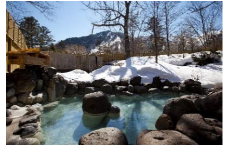
水曜日 奥日光森のホテル 奥日光随一の規模を誇る大露天岩風呂