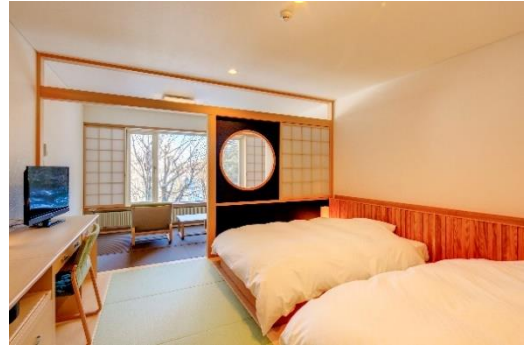
モダンな雰囲気の漂う和洋室