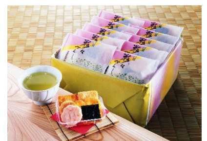
4. 7種類の煎餅が入った「彩々づくし」味わう楽しみと満足感が得られる一品です