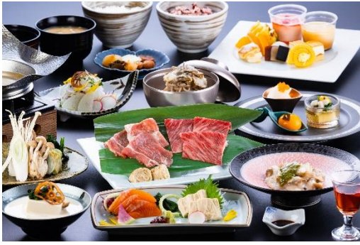
日替りの季節の会席料理「誉（ほまれ）」