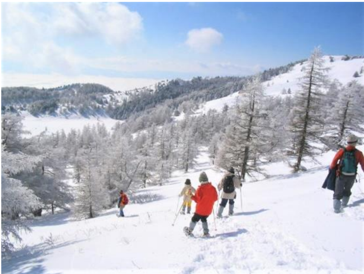
婦恋村のパウダースノーをお楽しみください

群馬県の西端、高原野菜の産地や愛妻家の聖地として知られる婦恋村に建つリゾートホテル「休暇村婦恋鹿沢」(所在地：群馬県吾妻郡婦恋村田代 1312、支配人：小森克敬)では、卒業シーズンに合わせて「卒たび学割プラン」を1月20日より販売します。今年学校を卒業する方限定のプランで、Instagramにハッシュタグ投稿していただくと、特別割引に加え特典が付いてくるお得な宿泊プランです。