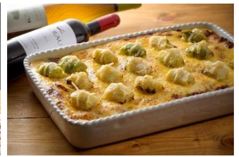
婦恋ミニロールキャベツの ラザーニャ