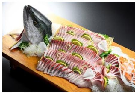
【冬期限定ビュッフェメニュー】 寒ブリのお造り