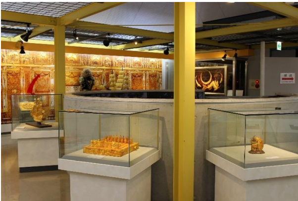
博物館の新館は「体験型」で琥珀に触れることができ、本館では世界中の琥珀を見学できます

特 典：・国内唯一の琥珀博物館「久慈琥珀博物館」の入館券引換付き ・ガチャカプセルに入った琥珀原石掴み取りにチャレンジ