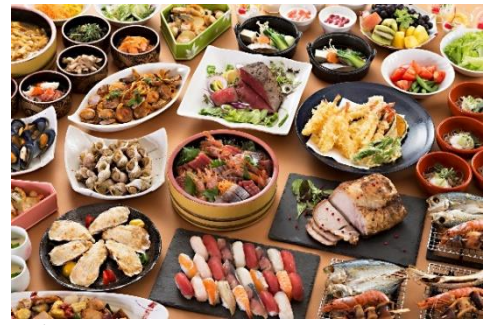
「海の幸」「山の幸」を堪能できる「三陸のシーサイドビュッフェ」

陸中海岸のほぼ中央に位置する休暇村陸中宮古。今年4月に創立50周年を迎えます。遙か太平洋を見渡す海岸沿いには随所に景勝地があり、三陸の景観や遠野・平泉への観光拠点としても至便です。敷地内の遊歩道の展望台から昇る本州最東端宮古市の「日の出」は圧巻です。夕食や朝食は三陸の「海の幸」と「山の幸」をお好きなだけ味わえるビュッフェスタイルでご提供しています。ハーフサイズの牛乳瓶にギュッと詰め込まれた海鮮を豪快にご飯に盛り付けて食べる、大人気の新ご当地グルメ「瓶ドン」は朝食でご提供しています。