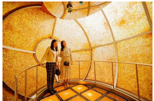
新館のシンボル「太陽の石」の内部 ギリシャ神話に出てくる太陽の石と言われる琥珀の伝説をもとにした琥珀の体験ドームです