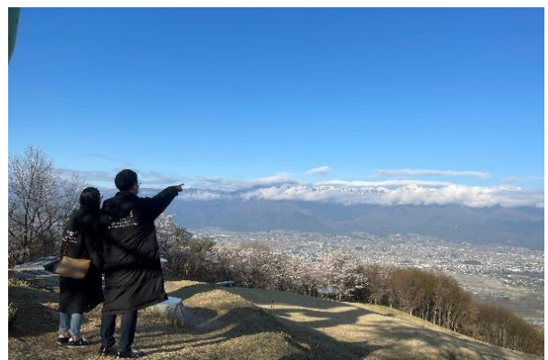
長峰山は、正面に北アルプスの雄大な山々と、眼下には幾筋もの川が流れる安曇野が一望できるビューポイント