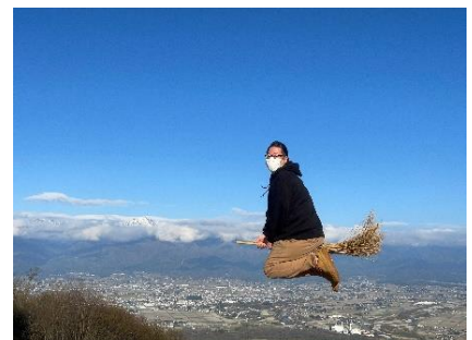
すがすがしい朝のきれいな空気は 思わず飛びたくなるらしく、竹ぼう きの貸し出しもあります