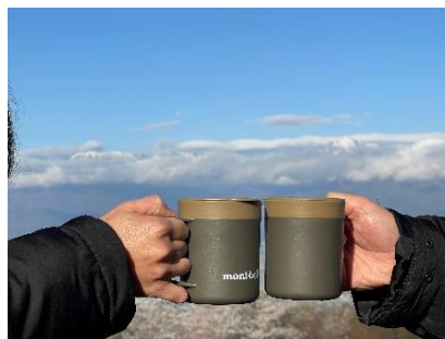
目の前の絶景を眺めながら淹れ立 ての美味しいコーヒータイム