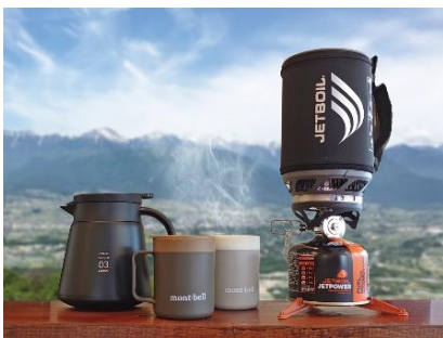
1杯1杯丁寧にハンドドリップした コーヒーをゆっくりと味わえます