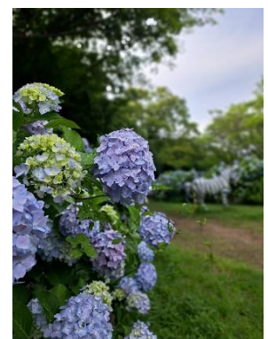
彩り鮮やかなアジサイ

https://www.youtube.com/watch?v=iKBFNMZR9xY&t=6s