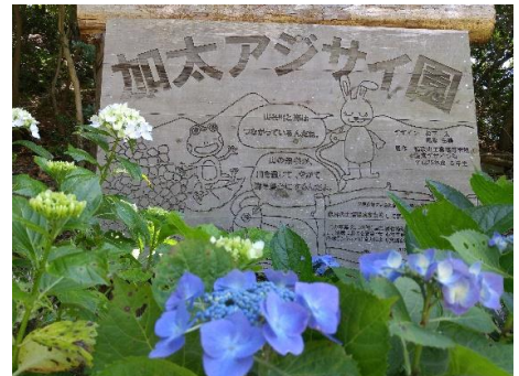
地元高校生が森林公園の木で制作