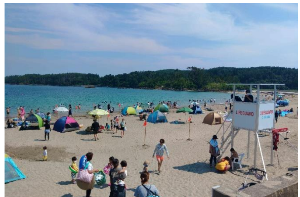
浜辺からみえる大前見島と小前見島が、風波を遮ってくれるため、波は比較的穏やかです

小田の浜海水浴場は緑の真珠・大島の東部にあり、半円形のカーブを描いた美しい砂浜を誇る海水浴場です。環境省選定の「快水浴場百選」にも選ばれ、美しい景観と水質環境は高い評価を受けています。波静かな遠浅の海水浴場としてシーズン中は県内外からも多くの人々が訪れ、このたび2023年に続いて国際認証制度「ブルーフラッグ」に認証されました。