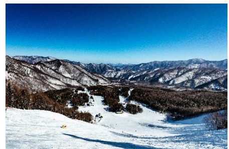
ゲレンデからの眺望

ゲレンデからは雄大な乗鞍岳を望み、18歳以下はリフト券が無料という全国でも珍しい取り組みを実施。レストラン、スキースクール、キッズゲレンデ、レンタルも完備し、家族みんなで冬を満喫できます。