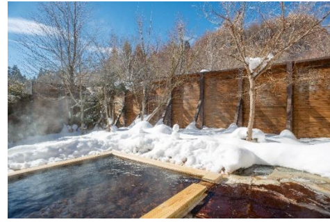
地下 1300m より湧き出す天然温泉 季節の風景や星空を臨む露天風呂