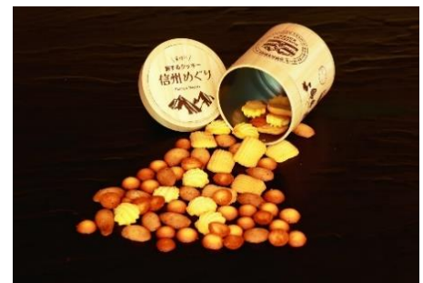
「旅するクッキー 信州めぐり」

クッキー缶：信州の恵みをぎゅっと詰め込んだ、4つの味が楽しめるご当地クッキー缶。