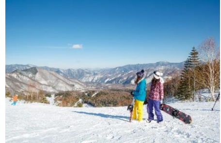
18歳以下はリフト券が無料