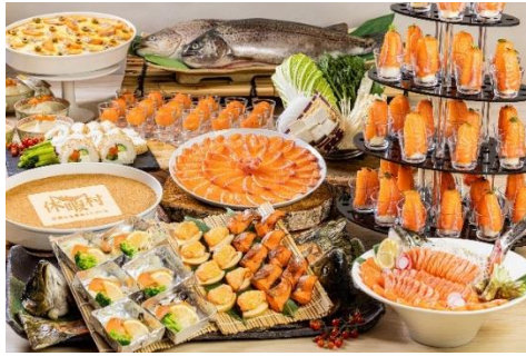
信州うまいもんビュッフェ 信州サーモンと地元洋菓子店スイーツフェア