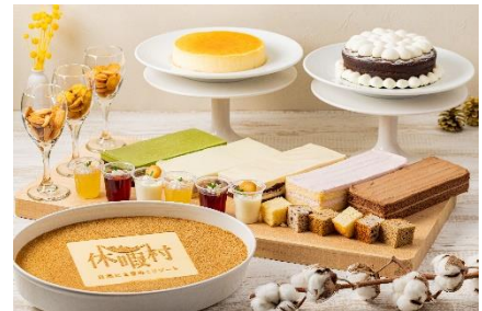
地元洋菓子店セラのスイーツ食べ放題