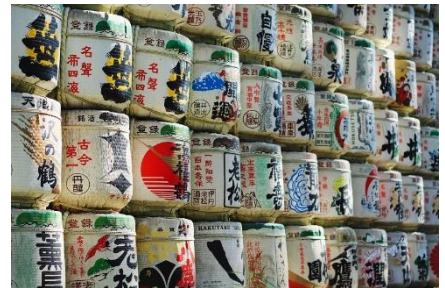
“隠れた酒処”にふさわしい 多種多様な広島地酒50選