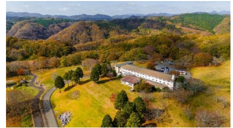
広大な園地内で初秋を満喫

中国山地に位置する全長約18kmにも及ぶ帝釈峡。国の天然記念物「雄橋」や奇勝奇岩で有名な鍾乳洞の「白雲洞」など美しい景観が見られます。散策路も整備されており新緑や紅葉の時期は多くの方が訪れます。休暇村帝釈峡は観光遊覧船で知られる神龍湖に近い高台に位置しています。敷地内にはホテルの他にコテージやキャンプ場といった宿泊施設や芝ソリ・テニスといったアクティビティも充実しています。