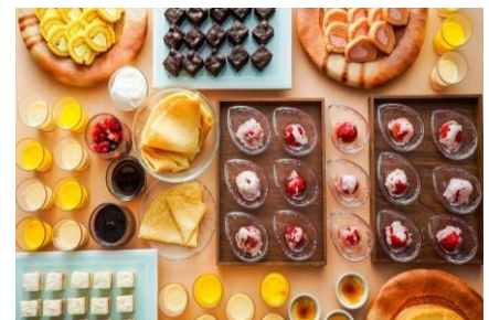
さとやまビュッフェ