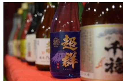
美しく並べられた広島県の地酒

休暇村帝釈峡の 50 周年企画として販売している「広島地酒 de 運試し」は広島県の酒造の多さに着目した所から始まりました。広島県の酒造数は全国第 7 位タイを誇る“隠れた酒処”。この魅力をいかにアピールするかを考えて生まれた企画です。