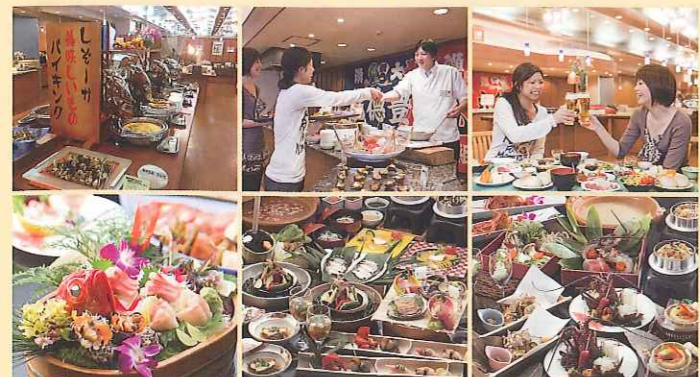
金目鯛会席 (春) あわび会席 (夏) 伊勢海老会席 (秋)