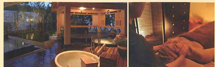
下賀茂温泉 鈴の湯 エステルーム COCOMI 心海

休暇村の大浴場は、伊豆随一の湯量を誇る下賀茂温泉を源泉とする温泉で、内湯のほか庭園露天風呂や掛け流しの2つの壺湯もあります。温泉のあとには、海を望むエステルームで波音を聴きながらオイルマッサージもお楽しみいただけます。