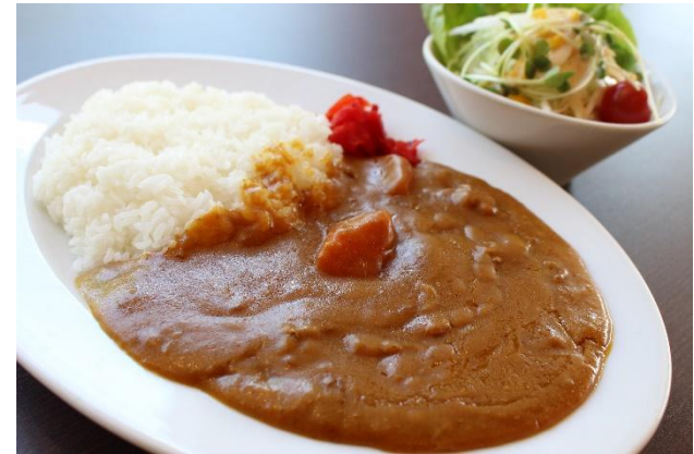
おまかせ昼食(一例)