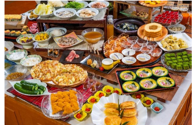
夕食ビュッフェ(一例)