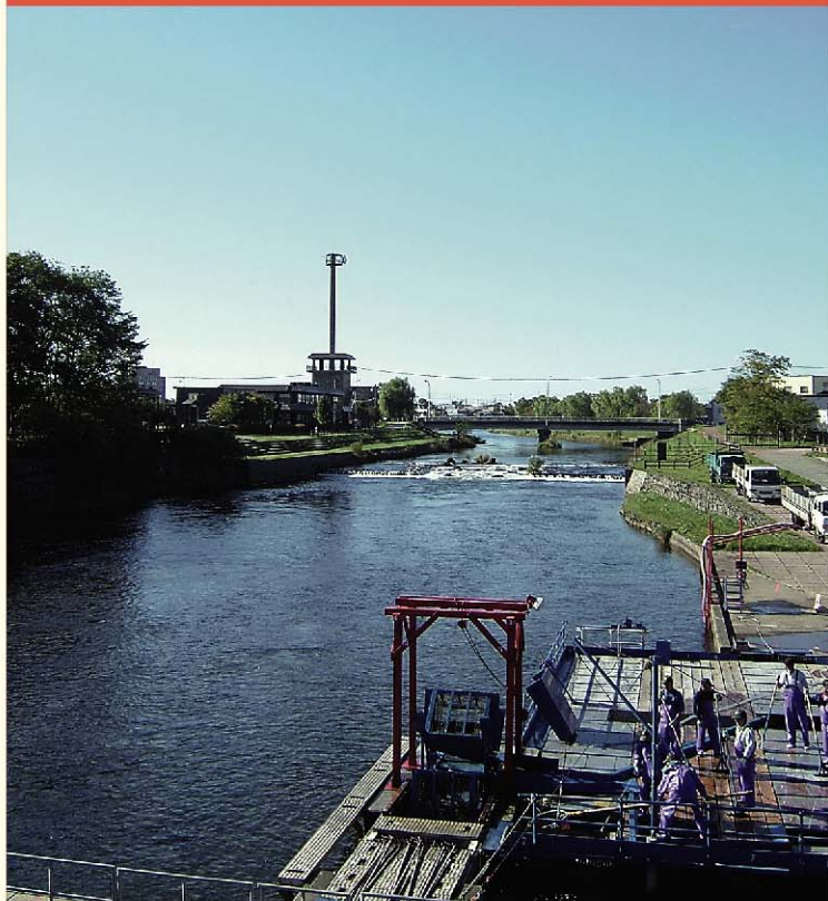
千歳川とインディアン水車